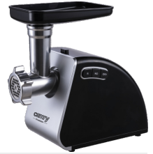
MEAT MINCER CR 4812