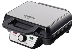
WAFFLE MAKER CR 3046