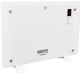
GLASS HEATER CR 7721