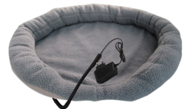
HEATED ANIMAL DEN CR 7431