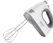
MIXER CR 4220