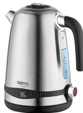
ELECTRIC KETTLE CR 1291