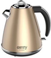
ELECTRIC KETTLE CR 1292