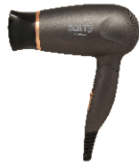
HAIR DRYER CR 2261