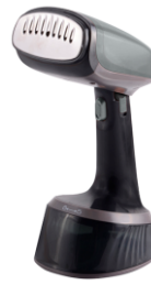
GARMENT STEAMER CR 5033