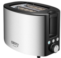
TOASTER 2 SLICES CR 3215