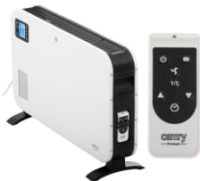
CONVECTION HEATER CR 7724