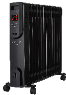
OIL FILLED RADIATOR CR 7814