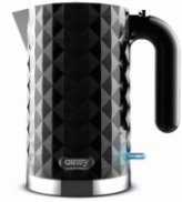
Electric Kettle CR 1169