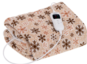
HEATING UNDERBLANKET CR 7430