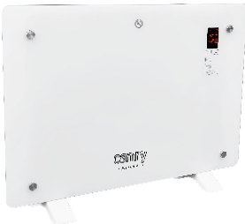
GLASS HEATER CR 7721