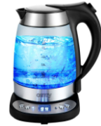
ELECTRIC GRILL CR 3044