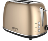
TOASTER 2 SLICES CR 3217