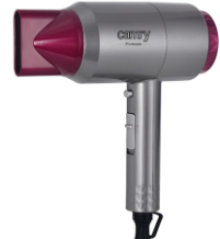
HAIR DRYER CR 2256