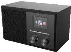
INTERNET RADIO CR 1180