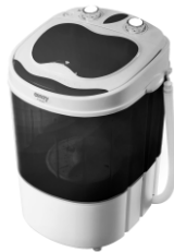
WASHING MACHINE CR 8054