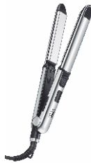
HAIR STRAIGHTENER CR 2320