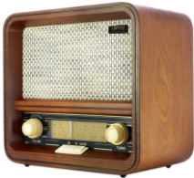
RETRO RADIO CR 1188