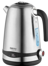
ELECTRIC KETTLE CR 1291