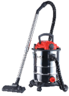
VACUUM CLEANER CR 7045