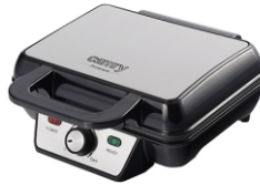
WAFFLE MAKER CR 3046