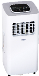
AIR CONDITIONER CR 7926