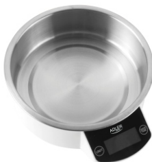
Kitchen Scale AD 8121