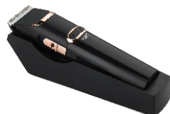
Hair Clipper AD 2832