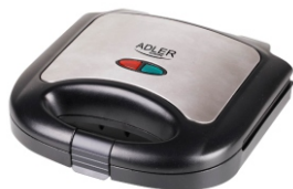
Sandwich maker AD 3015