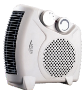
Diet Kitech Scale AD 3133